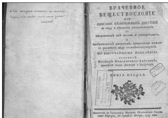
Рис. 1. Экспонат из книжной коллекции фармацевтического музея Н.М. Максимович-Амбодик. Врачебное веществословие. Кн. II. – СПб., 1785 г.

В дар от Фармтреста музей получил коллекцию новейших для того времени патентованных средств, коллекцию фотографий, снимков со старинных гравюр, картин и рисунков по истории фармации и коллекцию фото современных аптек, заводов и фабрик, проекты новых аптек. Благодаря кропотливому труду сотрудников музея и фармотдела в короткие сроки были сформированы редчайшие коллекции по истории и современному состоянию отечественной фармации и аптечному делу. Большую роль в формировании коллекций фармацевтического музея сыграл заведующий музейно-выставочным отделом НКЗ РСФСР профессор А.В. Мольков. Сохранился подписанный им запрос от 19 октября 1921 г. № 19, адресованный в Народный Комиссариат земледелия, в котором он просил оказать содействие сотруднику музея П.А. Двинянинову по снабжению возможным материалом для выставки по культуре лекарственных растений [6]. В 1924 г. председатель научно-фармацевтического кружка И.И. Левинштейн и заведующий фармотделом НКЗ П.А. Двинянинов выступили в печати с обращением ко всем фармацевтам о помощи в сборе и изучении исторического материала. Откликнулись многие учреждения Фармтреста, и в музей поступили многочис-