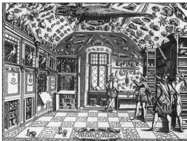
Рис. 4. Кабинет натуралий. Музей Ферранте Императо в Неаполе. С гравюры XVI века